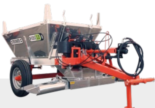
INOX | HIDRÁULICA