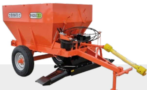
AÇO CARBONO | CARDAN