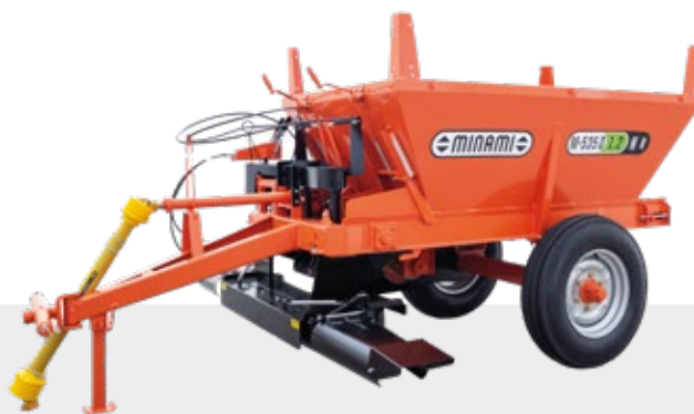
AÇO CARBONO | CARDAN