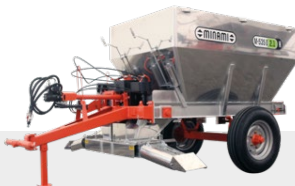
INOX | HIDRÁULICA